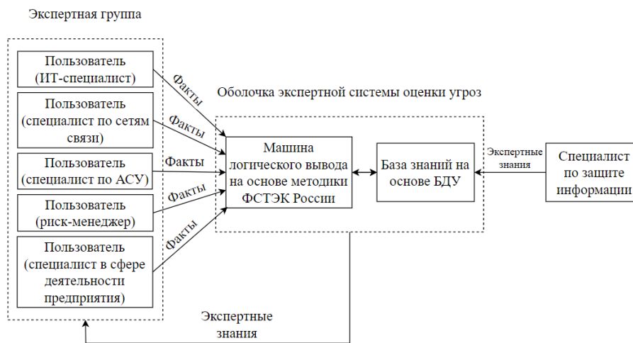
Рис. 3. Структура ЭС оценки угроз безопасности информации

где i – индекс, соответствующий одной из 222 угроз безопасности информации в БДУ ФСТЭК России; Ai – актуальность i -й угрозы; Vi – негативные последствия, связанные с ущербом от i -й угрозы; Oi – объект воздействия i -й угрозы; Hi – нарушитель (источник i -й угрозы); Ci – способ реализации i -й угрозы [4].